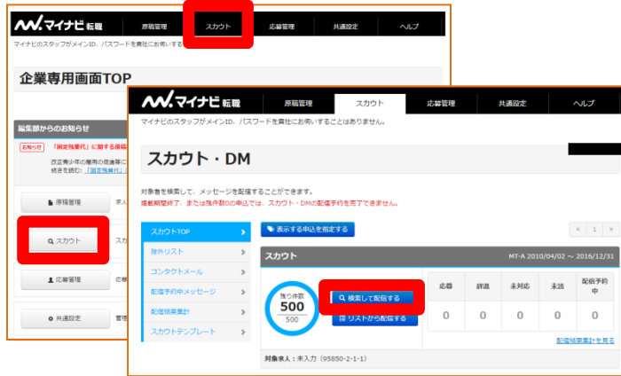
①スカウト検索画面を開く