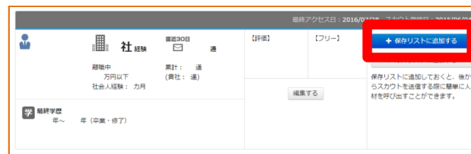
⑤配信対象者を『保存リスト』に登録