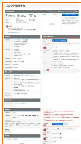
④スカウト会員のWEB履歴書を確認