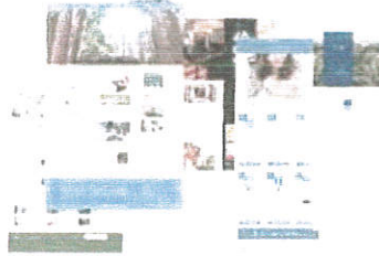
▲ 大手の顧客からオシャレなショップまで様々なジャンルのサイト制作に関わります♪