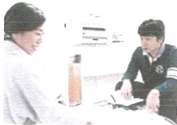
▲ ★お互いに意見を出し合いながらより良いものを作っていきます★

進行管理役(ディレクター)と作業員(デザイナー・コーダー)の互いの協力で現在ほぼ残業時間ゼロを守れています。状況によっては一部在宅で進めることも可能。働く方の環境や価値観を大切に、伸び伸びと楽しく働いていただける環境づくりに取り組んでいますので、雰囲気はとても自由ですよ。