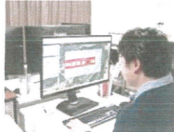
▲ 専属のプログラマーも在籍。自社商品にも力を入れています！